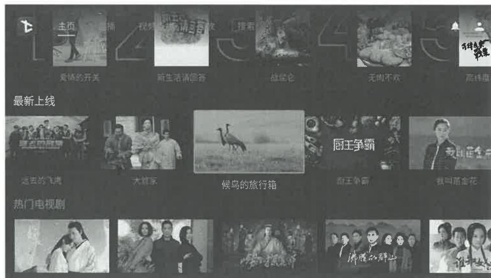
Sinow 海外客户端播出截图